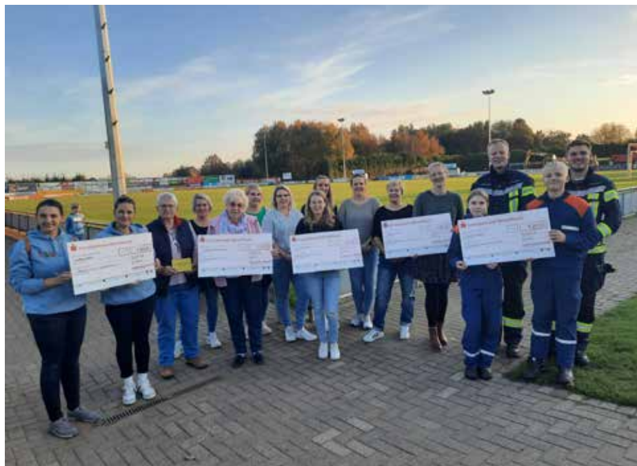
Die Aufnahme zeigt die Beschenkten mit Mitgliedern des Orga-Teams der Kinderkleider- und Spielzeugbörse nach den Scheckübergaben.